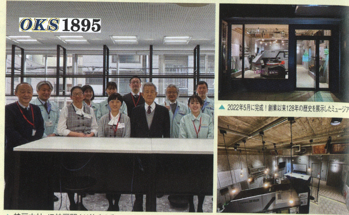
▲神戸本社 JR神戸駅より徒歩3分 ▲2022年5月に完成!創業以来128年の歴史を展示したミュージアム ▲往年のマシンや手作りの金網製品を展示

弊社は1895(明治28)年に金網の製造、販売業として創業して以来今年で128年目を迎えました。最近では主にパンチングメタル(打抜き金網)などの製造・販売を行っております。得意とする技術は板厚より小孔径・小ピッチの「スーパーパンチング」です。また東レグループ企業との共同でCFRTPシート製パンチングやエキスパンドメッシュを業界初で開発したり、開孔率90%以上の「大開孔率パンチング」の製作にも力を入れております。