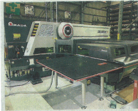
導入したファイバーレーザーパンチング複合機

『明石工場にアマダ製ファイバーレーザーパンチング複合機「EMLZ2515AJ」を投入しました!』の記事が掲載されました!