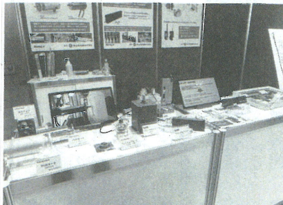
青山特殊鋼のブース

ブースでは従来のステンレーナーと二相鋼ステンレーナーを並べて展示し、ろ過性能改善や清掃性に優れた点をアピール。従来のステンレーナーは清掃作業で圧力や負荷がかかり、金網が破けてしまうことから、高い強度と優れた清掃性を持つ二相鋼ステンレーナーが注目を