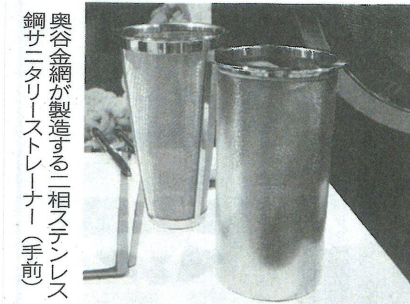
奥谷金網が製造する二相ステンレス鋼サニタリーストレーナー(手前)

造の奥谷金網製作所は「二相ステンレス鋼サニタリーストレーナー(異物除去器)や二相鋼製パンチングなどを展示。二相ステンレス鋼サニタリーストレーナーは、日鉄ステンレスの二相ステンレス鋼「NSSC