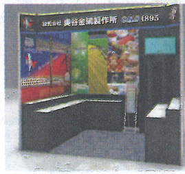
ブースイメージ図

過・造粒用などの各種パンチングメタル、金網加工品などを紹介する予定だ。今回の展示では、N