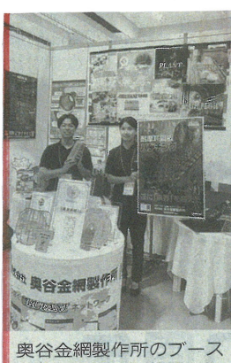
奥谷金網製作所のブース